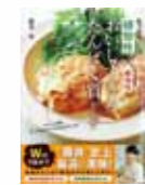
おいすぎるたんぱく質おかず