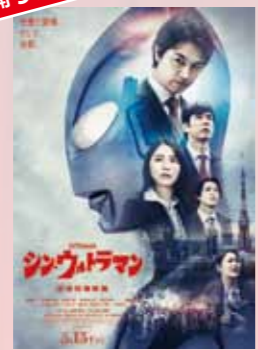
シン・ウルトラマン