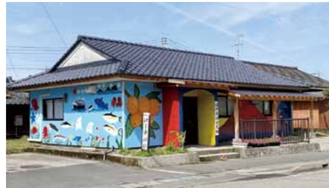
▲国道沿いの自治公民館の壁に大きな壁画が完成しました

今年3月、松ヶ崎地区の辺田自治公民館に大きな壁画が完成しました。これは、同地区の地域振興計画「松ヶ崎づくり計画」に基づき、同公民館を地域のシンボルとして地域内外に発信したいという目的で、地域住民、松ヶ崎小学校の児童、垂水高等学校の美術部員、地元業者等が協力し作成したものです。壁画には、桜島、特産品のびわ等、同地区の魅力が描かれています。児童は「大きな絵で大変でした。たくさんの方に見てほしいです」と話しました。今後、交流拠点として地域活動がさらに活発化することが期待されます。