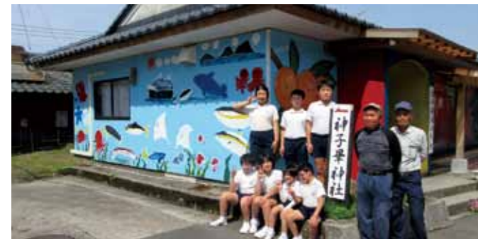
▲松ヶ崎小学校の児童のみなさん