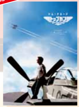
トップガン マーヴェリック