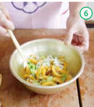
⑥④と⑤をボウルに入れて軽く混ぜる。