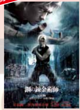
鋼の錬金術師 完結編 復讐者スカー