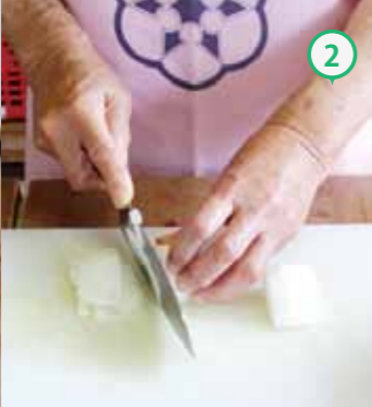
②新玉ねぎは薄くスライスする。