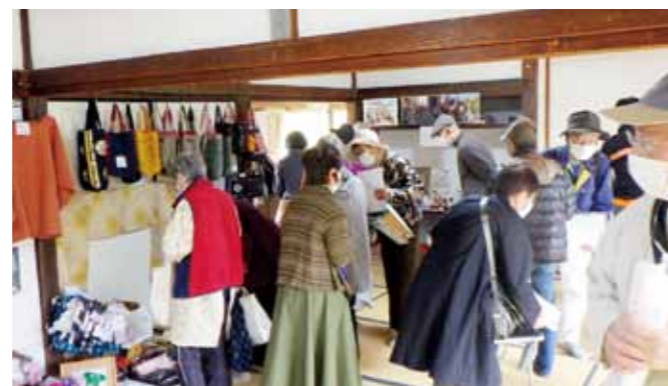
▲賑わった物販の様子

4月3日、垂水小学校横の旧有馬邸で、『さんがつの節』と『麓祭り』が開催されました。これは、垂水で昔から続く桃の節句の祭りとして日本遺産である『麓』で郷土の魅力や歴史を伝えようと日本遺産「薩摩の武士が生きた町」魅力発信推進協議会垂水支部が企画したものです。当日は、小物類、ちらし寿司等の販売、伝統芸能である『御所のお庭』（新城麓）と、『中俣（下）川踊り』（協和地区）が披露されました。来場者は「垂水らしい春を感じることができました」と話しました。歴史と文化に触れられる祭りで優雅なひとときを体験できました。