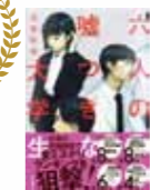
六人の嘘つきな大学生