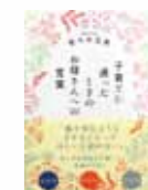
子育てに迷ったとき お母さんへの言葉