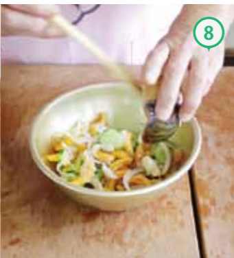
⑧さらに、味を見ながらマヨネーズを加える。