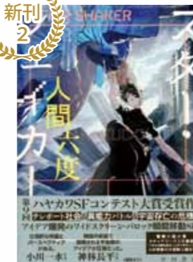
スター・シェイカー （人間六度）

人間がテレポート能力に目覚めた近未来。事故で能力を失った赤川勇虎は、ある組織から逃げた少女ナクサと出会う。逃亡の果て超越的な能力に目覚めた勇虎は、宇宙の根幹に関わる秘密を知り…。