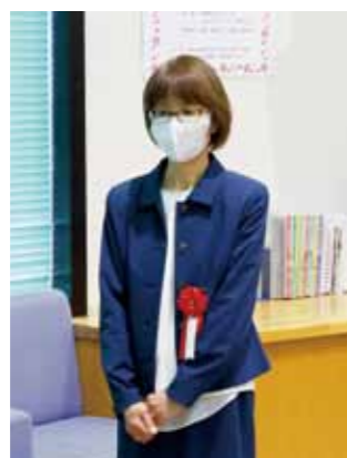
▲おはなしサークル『野いちご』