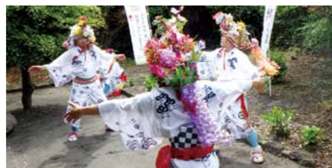
▲『中俣（下）川踊り』を踊る皆さん