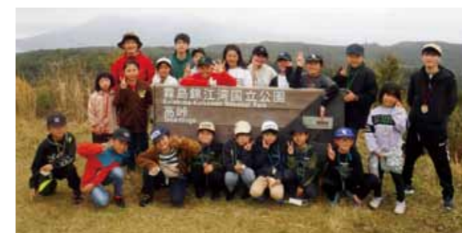
▲予定より早く頂上に到着