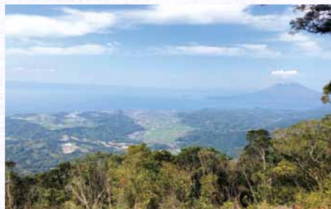
▲白山の頂上からの風景

◎垂水市公式WEBサイト ⇒市政の動き ⇒ 広報・広聴 ⇒ 広報誌 ⇒ 広報誌お便り