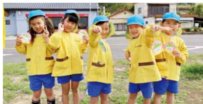
▲お守り作ったよ。交通ルールを守ってね。