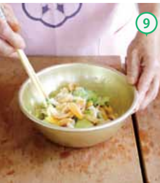
⑨混ぜ合わせれば・・・