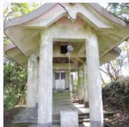
▲頂上にある白山神社

※秘書広報係の職員が白山登山を行った際の頂上からの景色です。写真では伝わらない感動が頂上にはあるようです。ぜひ登ってみてはいかがでしょうか。