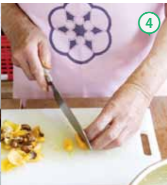
④びわを食べやすい大きさにスライスし種や薄皮を取り除く。 ※色止めに塩水に漬ける。