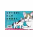
ながないがいねこの おかあさん