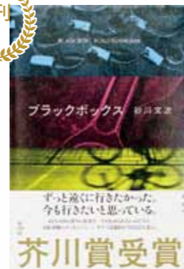
ブラックボックス （砂川文次）

ずっと速くに行きたかった。今も行きたいと思っている。自分の中の怒りの暴発を、なぜ止められないのだろう。自衛隊を辞め、いまは自転車のメッセンジャー、サクマは都内を今日もひた走る。