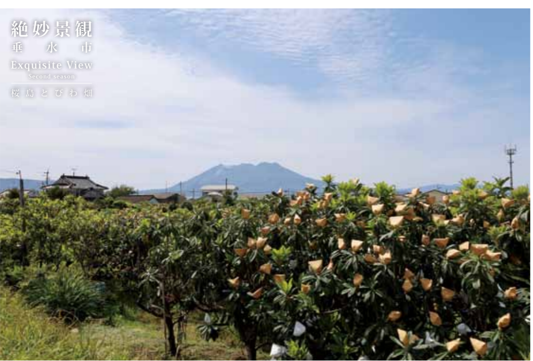
本号 (5月号) 絶妙景観