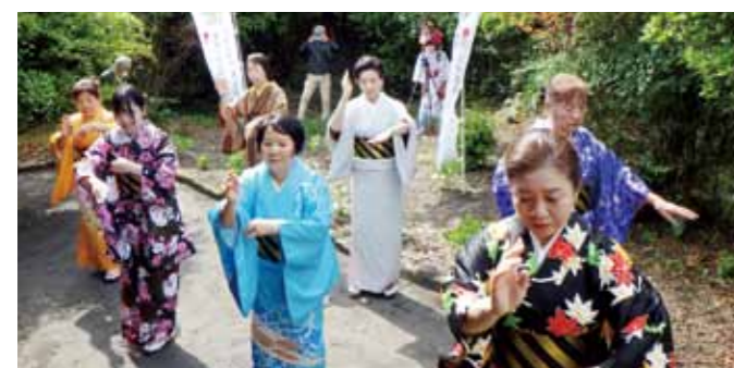
▲『御所のお庭』を踊る皆さん