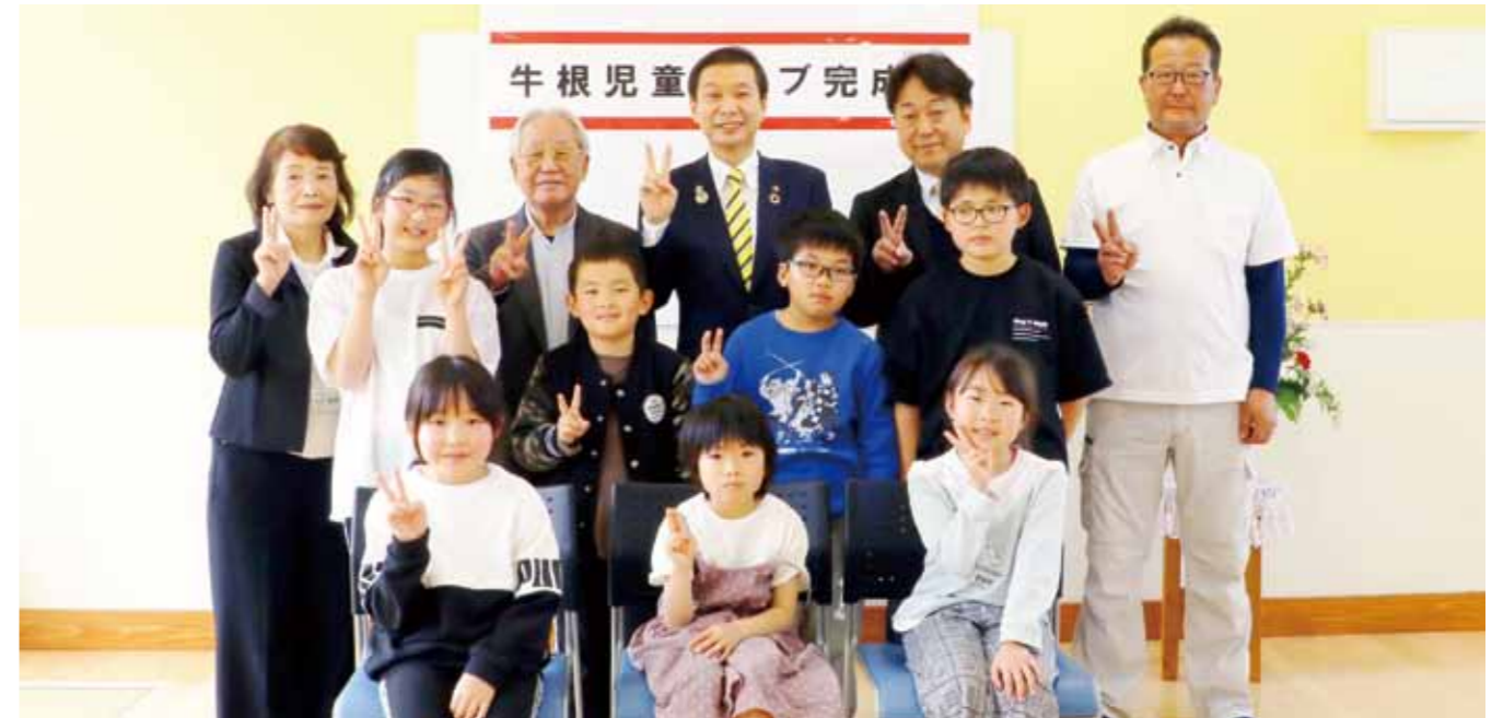
▲完成式の出席者で「はい、ピース」