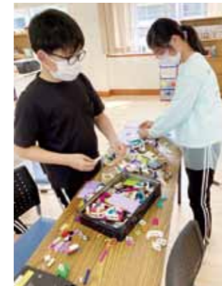
▲ブロックで何を作ろうかな