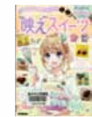
まわりと差がつく！ 「映え」スイーツレシピ