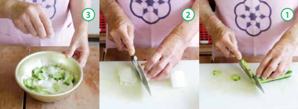
①きゅうりを輪切りにする。

今が旬の「びわ」と「新玉ねぎ」を使用した簡単なサラダです。「びわ」はカロテンが豊富に含まれているため、高血圧、脳梗塞、心筋梗塞等の生活習慣予防やがんの予防の効果が期待できます。