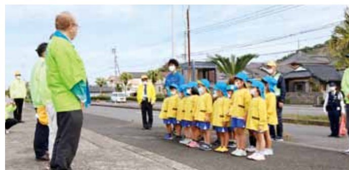
▲園児による誓いの言葉

4月6日、市役所新城支所前パーキングエリアで、春の全国交通安全運動の街頭キャンペーンが行われました。これは、毎年、春の全国交通安全運動の期間に、多くの方に交通安全思想の普及・浸透を図り、交通ルールの遵守と正しい交通マナーの実践を習慣付け、交通事故防止の徹底を図ることを目的に、全国各所で行われているものです。当日は、鹿屋警察署垂水幹部派出所の職員をはじめ、交通安全協会等の方々やさざなみ保育園の園児16人が参加し、園児手づくりの交通安全お守り等をドライバーに手渡し、交通安全の啓発活動に取り組みました。園児たちは「頑張ってお守りを作りました。運転をする人たちは、安全に運転してほしいです。横断歩道を渡る時は大きく手をあげて渡ります」と誓いの言葉を述べました。園児たちからお守りを受け取ったドライバーは「かわいなお守りももらえてうれしいです。園児たちの笑顔忘れず、交通ルールを守り運転をしていきたいです」と話しました。園児たちからのお守りを受け取り、安全運転への意識が高まったことでしょうか。ドライバー、歩行者も交通ルールを守り、お互い笑顔で家に帰ることができるように、交通事故ゼロを目指しましょう。