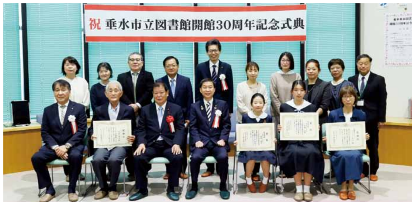
▲出席者一同の集合写真