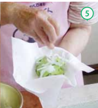
⑤③を水で洗い、キッチンペーパーで水気をしっかりと取る。