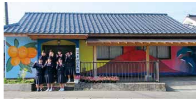
▲垂水高等学校の美術部員のみなさん