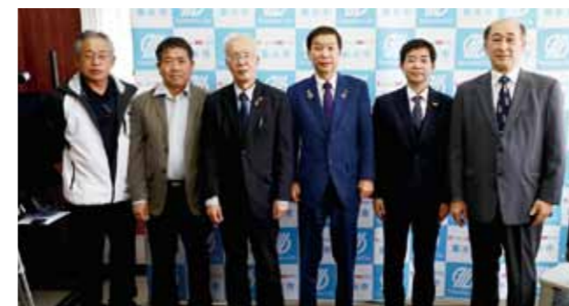
▲保護司関係者市長室訪問

3月25日、鹿児島保護観察所所長、肝属保護区保護司会会長、垂水市保護司の方々市長室を訪れました。保護司とは、犯罪や非行をした方の立ち直りを地域で支える法務大臣から委嘱された民間のボランティアで、各地域の保護司会に加入し、犯罪予防活動、広報活動等の組織的な活動を行っています。現在、垂水市では10人が保護司として活動されています。保護司の皆さんの活動に敬意を表し、これからの益々のご活躍により、安心・安全な地域社会が実現することを祈念いたします。