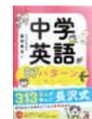
中学英語が 87パターンで 身につく