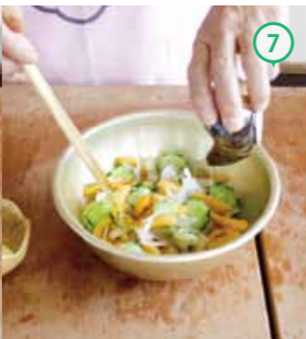
⑦はちみつを加え混ぜ合わせる。