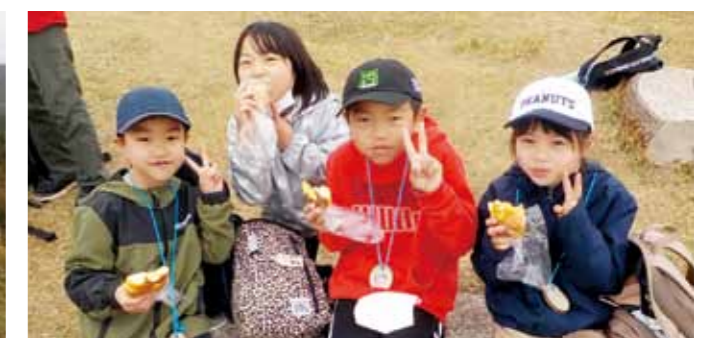
▲頂上で食べるパンは最高でした