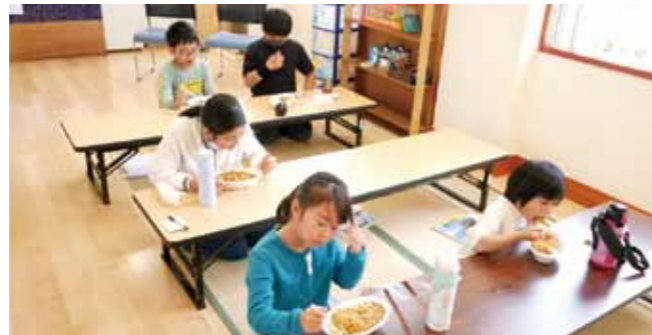
▲非常食の大切さも学習しました。カレー美味しかったです