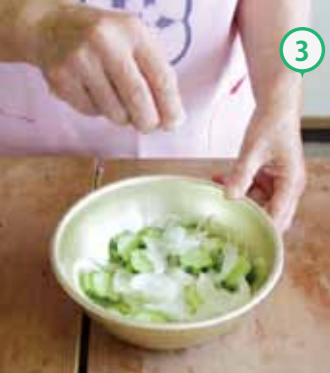
③①と②を塩で揉み、しんなりするまで、置いておく。