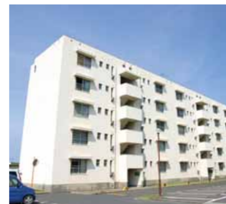
▲受け入れ先の市営住宅（錦江町定住促進住宅）