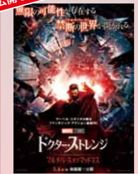
ドクター・ストレンジ マルチバース・オブ・マッドネス