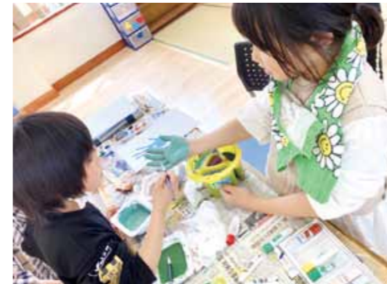
▲お絵描きしています